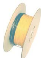
Нагревательный кабель DVC-10 - 10 Вт/м