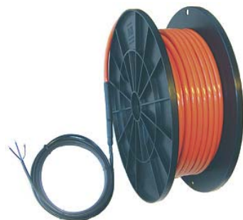
Нагревательный кабель DVT-30 - 30 Вт/м